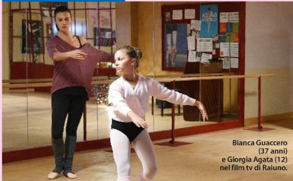
Bianca Guaccero (37 anni) e Giorgia Agata (12) nel film tv di Raiuno.